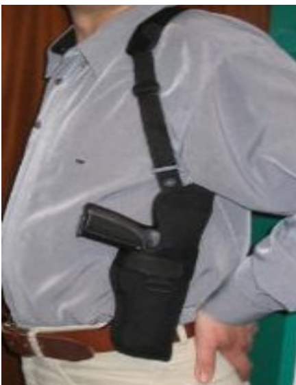
Schulterholster für das verdeckte Tragen