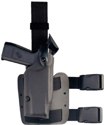
Tactical Holster für das Tragen am rechten Oberschenkel.

Im offenen Bereich (Uniformträger) erfreut sich das am Oberschenkel sitzende „Tactical-Holster“ ebenfalls großer Beliebtheit.